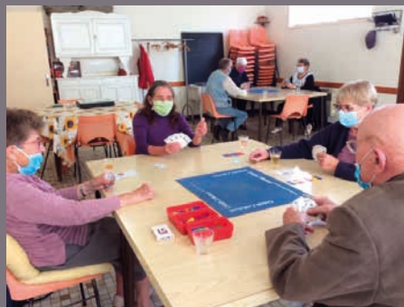
Défi à la belote au club du troisième âge avant le deuxième confinement

Nous vivons une période inédite depuis mars, ce n'est pas simple; ces instants vécus sont complexes pour chacun d'entre eux et d'entre nous. Plus que jamais nos valeurs sont nos armes : la solidarité et la bienveillance.